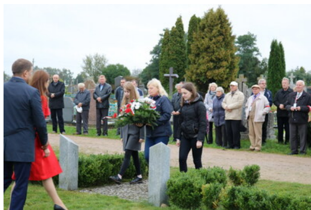
Złożenie kwiatów w Ejszyszkach