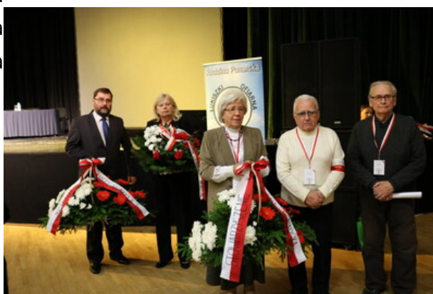
Złożenie kwiatów przed tablicą ponarską w Domu Kultury Polskiej w Wilnie