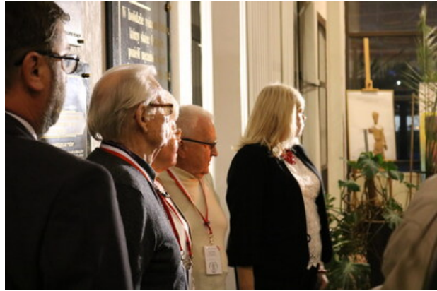
Złożenie kwiatów przed tablicą ponarską w Domu Kultury Polskiej w Wilnie