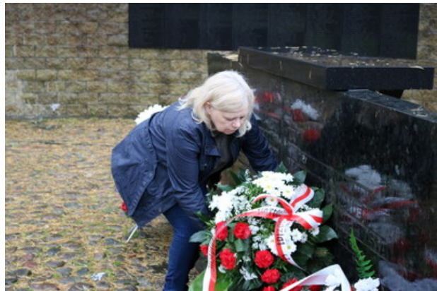
Złożenie kwiatów na kwaterze polskiej w Ponarach