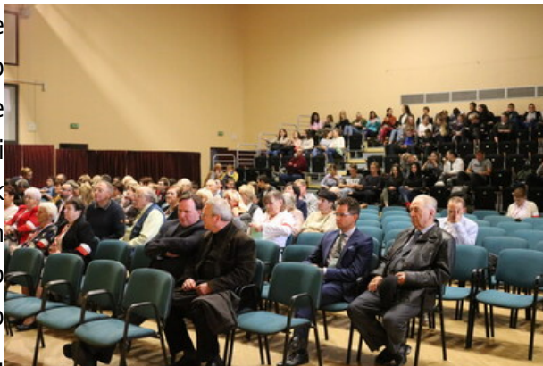
Konferencja Ponarska w Domu Kultury Polskiej w Wilnie