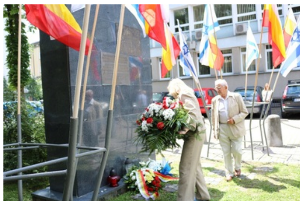
Złożenie kwiatów w imieniu Oddziału IPN w Białymstoku