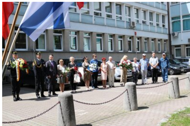
Uroczystość złożenia kwiatów pod Pomnikiem Wielkiej Synagogi