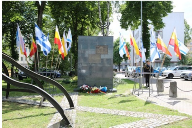
Pomnik Wielkiej Synagogi