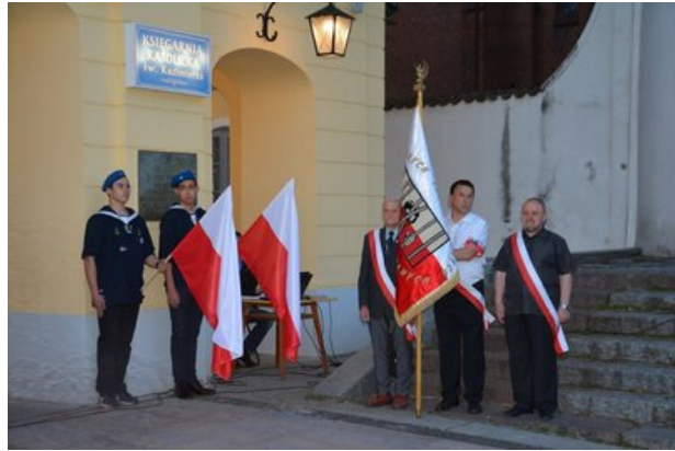
Wieczór Pamięci - Białystok, 25 maja 2017