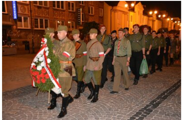
Wieczór Pamięci - Białystok, 25 maja 2017