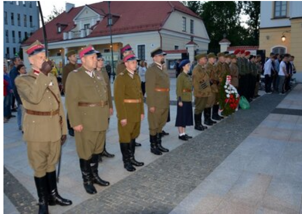
Wieczór Pamięci - Białystok, 25 maja 2017