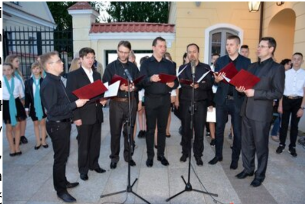
Wieczór Pamięci - Białystok, 25 maja 2017