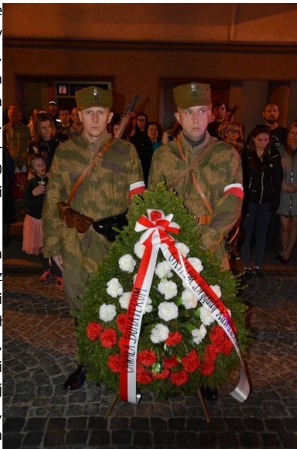
Wieczór Pamięci - Białystok, 25 maja 2017