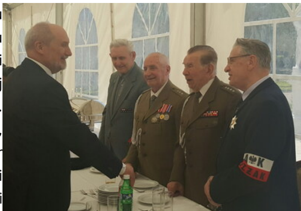
Minister obrony Antoni Macierewicz z białostockimi kombatanckami