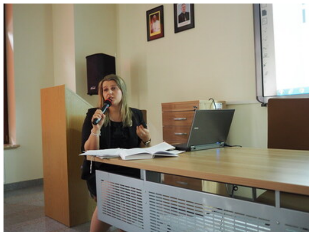
Promocja książki „Duszpasterstwo polskie na Wileńszczyźnie w okresie sowieckim (1944–1990)”