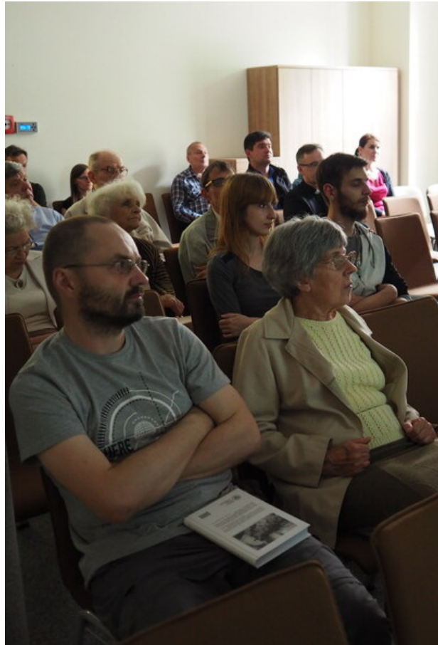
Publiczność „Przystanku Historia”