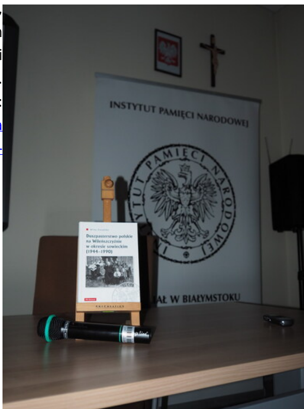
Książka o polskim duchowieństwie katolickim na Wileńszczyźnie