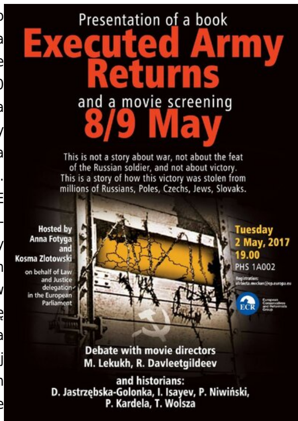
Prezentacja książki „Rozstrzelana armia powraca”