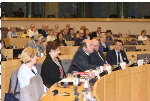
Prezentacja książki „Rozstrzelana armia powraca”