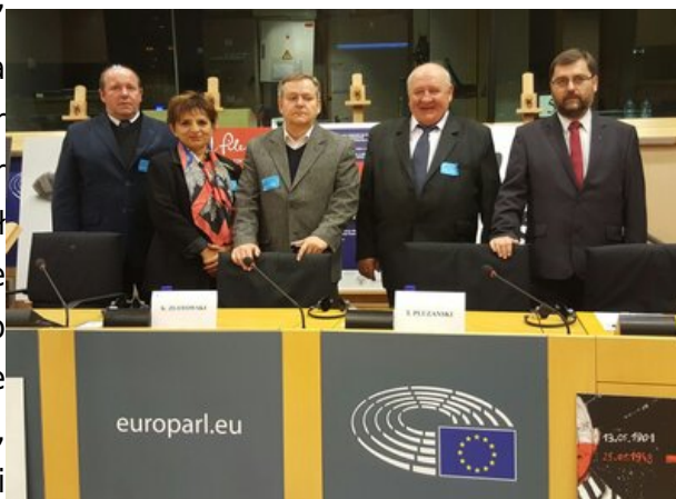
Prezentacja książki „Rozstrzelana armia powraca”