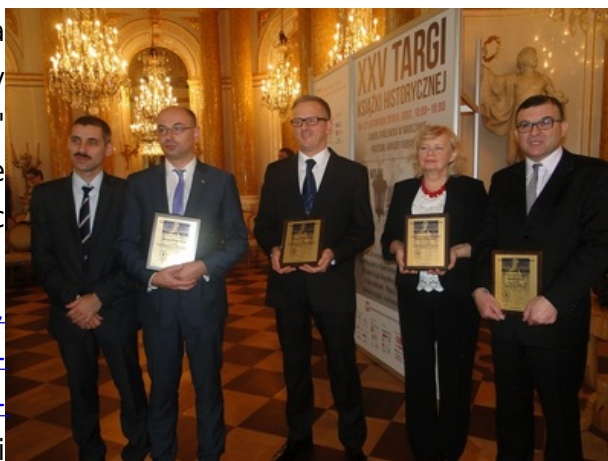
Laureaci nagrody „Klio” z IPN

Nagroda „Klio” została ustanowiona 21 lat temu przez Porozumienie Wydawców Książki Historycznej. Jej celem jest wyróżnianie polskich autorów i wydawców zajmujących się popularyzacją historii i literatury w