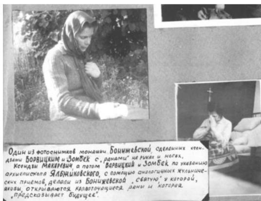
Один из фотоснимков монашки Боннижевской, сделанных ке- дзими Борвицким и Зомбек с, рднами” на руках и ногах, Кеондан Макервич, а потом Варвицкой и Зомбек по указанию архиепископа Ялбжиковского, с помощью аналогичных жульниче- ских плащев, делали из Боннижевской „святую”, у которой, яковы, открываются кровоточащая раны и которая, „предсказывает будущее”.

„Прифронский мо- нашеский дом и населяемый по себе в кий же Коегда зомбен забаи кроповиди афе характере гро сдннцан нелеган кого агнцсва.се бер агнелов” и Указиелес Прифр- ноной чакален, сетнолы.