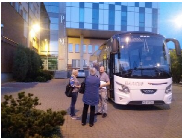
Ostatnie minuty przed odjazdem