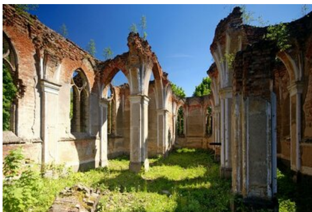
Ruiny kościoła w Jańowie