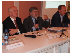
Konferencja naukowa „Objawa Augustowska - fakty, konteksty, postulaty badawcze”