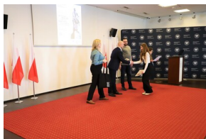
X edycja Ogólnopolskiego Konkursu Recytatorskiego „W kręgu poezji i prozy lagrowej obozu KL Ravensbrück”.