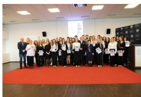
X edycja Ogólnopolskiego Konkursu Recytatorskiego „W kręgu poezji i prozy lagrowej obozu KL Ravensbrück”.