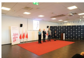
X edycja Ogólnopolskiego Konkursu Recytatorskiego „W kręgu poezji i prozy lagrowej obozu KL Ravensbrück”.