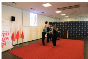
X edycja Ogólnopolskiego Konkursu Recytatorskiego „W kręgu poezji i prozy lagrowej obozu KL Ravensbrück”.