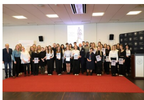
X edycja Ogólnopolskiego Konkursu Recytatorskiego „W kręgu poezji i prozy lagrowej obozu KL Ravensbrück”.